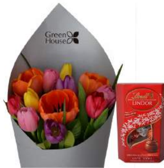
Glam Silver - 12 Tulipanes + Bombones Suizos Lindt