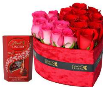
Rubí Corazón - 18 Rosas + Bombones Suizos Lindt