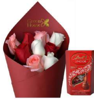
Ramo Mamá + Bombones Suizos Lindt