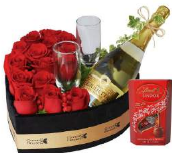
Corazón Celebración + Bombones Suizos Lindt