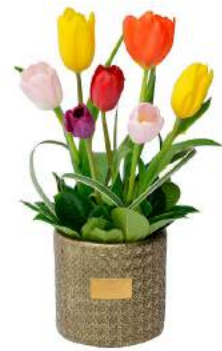
Glam Gold - 7 Tulipanes