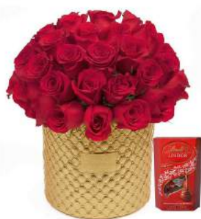
Glam Gold - 36 Rosas + Bombones Suizos Lindt