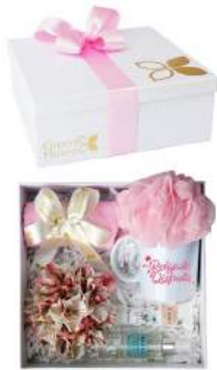
Pack Spa Especial