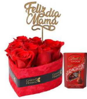
Rubí Corazón Mamá - 7 Rosas + Bombones Suizos Lindt