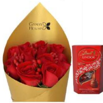
Ramo Glam Gold - 12 Rosas + Bombones Suizos Lindt