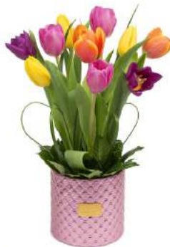
Glam Pink - 10 Tulipanes