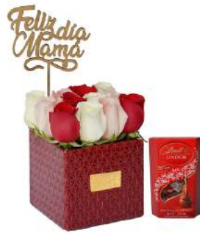
Box Rubí Mamá - 12 Rosas + Bombones Suizos Lindt