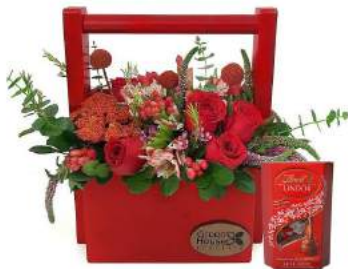
Jardinera Mamá + Bombones Suizos Lindt