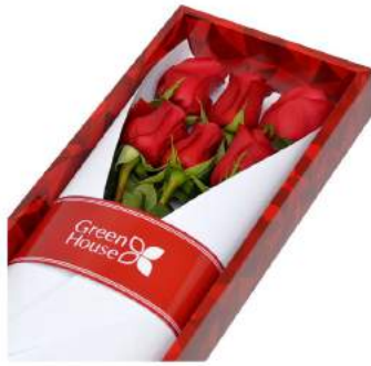
Caja Colección Rubí - 6 Rosas