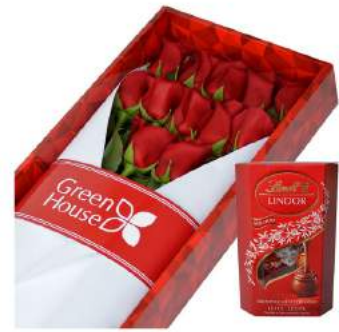
Caja Colección Rubí - 12 Rosas + Bombones Suizos Lindt