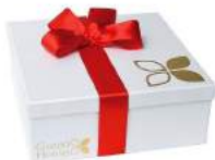
Pack Super Mamá