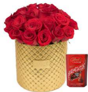
Glam Gold - 24 Rosas + Bombones Suizos Lindt