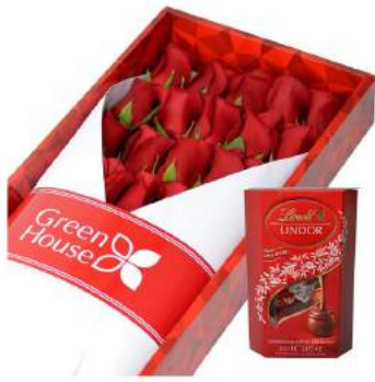
Caja Colección Rubi - 24 Rosas + Bombones Suizos Lindt