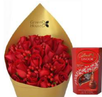
Ramo Glam Gold - 24 Rosas + Bombones Suizos Lindt