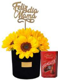
Glam Girasoles Mamá + Bombones Suizos Lindt