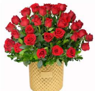
Glam Gold - 48 Rosas