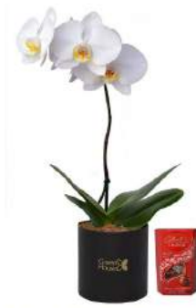
Planta de Orquídea Mediana + Bombones Suizos Lindt