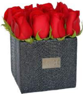
Glam Black - 12 Rosas